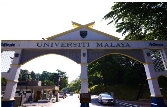
AKADEMI PENGAJIAN ISLAM UNIVERSITI MALAYA